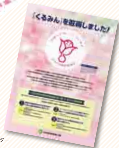
「くるみん」周知ポスター

女性活躍推進の効果を一段と発揮するため、職場単位で啓発活動を行うことを目的として、10支店（札幌、仙台、さいたま、東京、横浜、名古屋、大阪、広島、高松、福岡の各支店）に設置した「地域版女性活躍推進委員会」を中心に、全支店において、自発的な活動を推進しています。