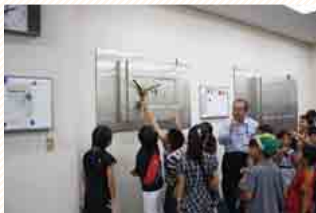
なかよしファミリーデー（家族の職場参観日）の様子